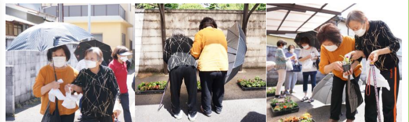
杖をつく方を支えながら来てくださる方。お花も一緒に選びます。