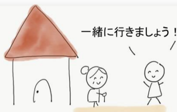
元民生委員さんなどが 地域の方に声かけ！