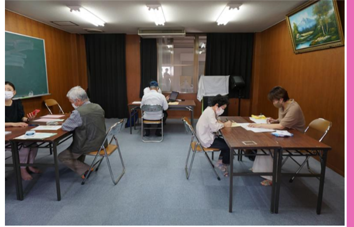
令和3年6月1日 赤部公民館 コロナワクチン接種予約会