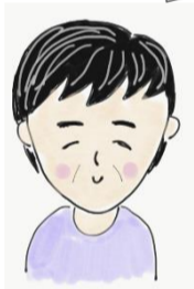
体操の後はおしゃべりタイム。