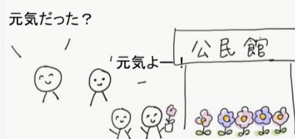
公民館前は地域の皆さんが集まって にぎやかに！