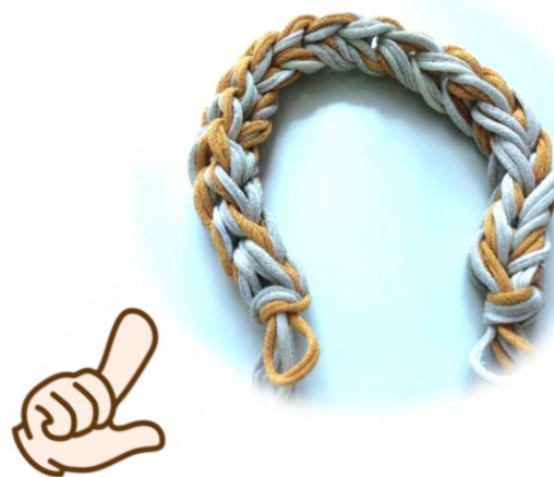
ロツソでつくったロープ